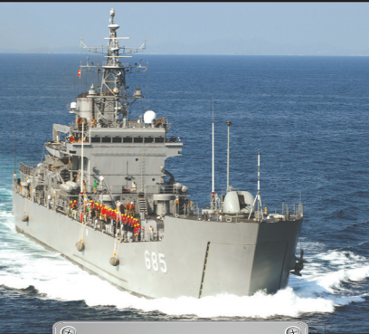
Seong In Bong

บริษัทที่สร้าง : Hanjin Heavy Industries ประเทศที่สร้าง : เกาหลีใต้ ปีที่สร้าง : ค.ศ. 1996 รุ่นและประเภท : Landing Ship Tank, Go Jun Bong Class ความเร็วสูงสุด : 16 นอต ความเร็วมีชัยสต์ : 12 นอต ระยะปฏิบัติการ : 4,500 NM ระบบอาวุธ : ปืนใหญ่ Emerlec ขนาด 30 มิลลิเมตร ปืนกล Breda ขนาด 40 มิลลิเมตร ปืนแกดลิง Vulcan ขนาด 20 มิลลิเมตร